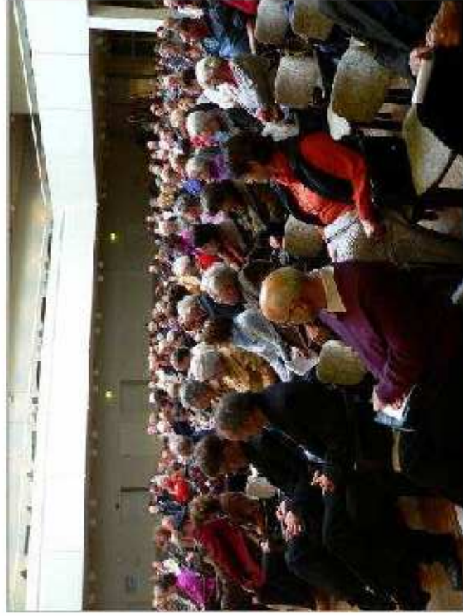
Bürgerinformationstag 7. März 2009 300 Neuwieder Bürger kamen auf Einladung der Kreisärzteschaft Neuwied

Wir begrüßen Sie herzlich auf den Seiten des Bürger/Patienten- Stammtische Neuwied.